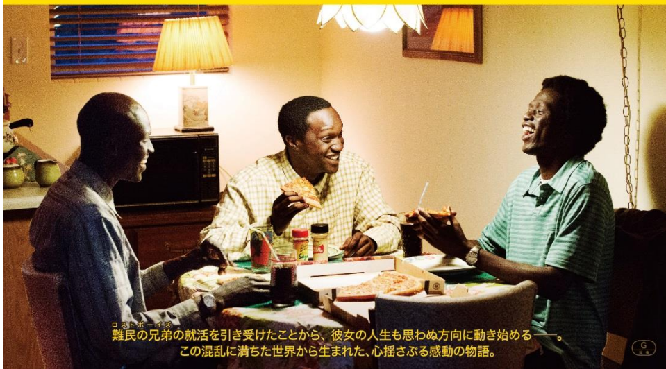
ロストボーイズ 難民の兄弟の就活を引き受けたことから、彼女の人生も思わぬ方向に動き始める。この混乱に満ちた世界から生まれた、心揺さぶる感動の物語。

ALCON ENTERTAINMENT, IMAGINE ENTERTAINMENT and BLACK LABEL MEDIA present a BLACK LABEL MEDIA, IMAGINE ENTERTAINMENT and RELIANCE ENTERTAINMENT production REESE WITHERSPOON "THE GOOD LIE" ARNOLD OKENG GER QUANYI EMANUEL JAL COREY STOLL created by MINDY MARIN music by MARION LEON music supervisor JONATHAN WALKINS costume designer SUTTIYAT ANNE LARIBAR edited by RICHARD COMEAU production designer AARON TISSORNE director of photography RONALD PLANTE executive producers ANDREW A. KOSOVE BRODERICK JOHNSON KIM ROTH ELLEN H. SCHWARTZ DEEPAK NAVAR BOBBY and DEB NEUMAYER producers by RON HOWARD BRIAN GRAZER KAREN KEHELA SHERWOOD MOLLY MICKLER SMITH THAU LOCKNOLL TRENT LOCKNOLL written by MARGARET MANGLE directed by PHILIPPE FALARDOU www.goodlie.jp